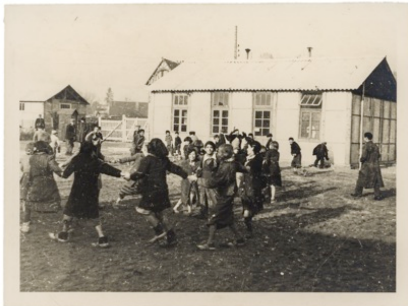
Enfants internés au Camp de Jargeau – Collection Lhomme-Rondeau, Cercil-Musée Mémorial des enfants du Vel d'Hiv.

En 1940, le Gouvernement de Vichy ordonna l'internement de tous les "Nomades" de France. 6.500 Tsiganes, pourtant de nationalité française, furent ainsi enfermés dans une trentaine de camps en France, jusqu'à la fin de la guerre. Partant de ce fait historique, ce film questionne le présent des Tsiganes aujourd'hui.